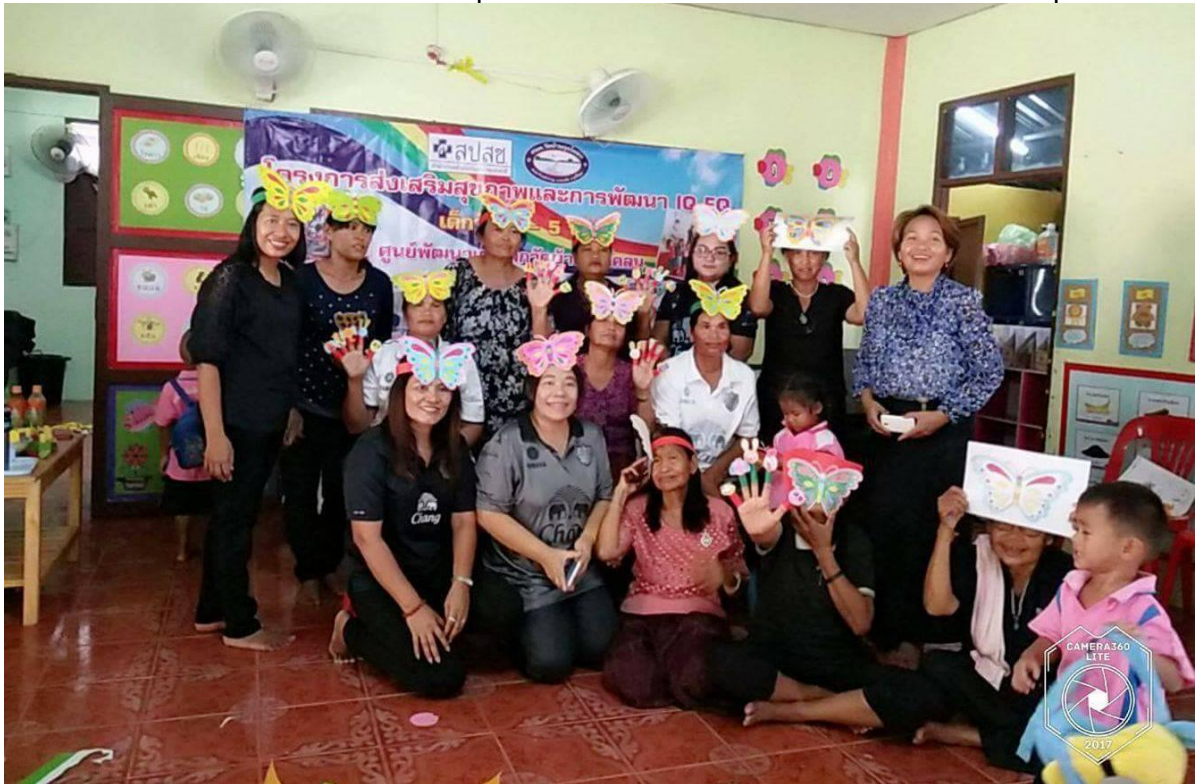
ภาพกิจกรรม โครงการพัฒนาส่งเสริมสุขภาพพัฒนา IQ-EQ เด็ก ๐ - ๕ ปี (ศพด.วัดบ้านกุดโคลน)