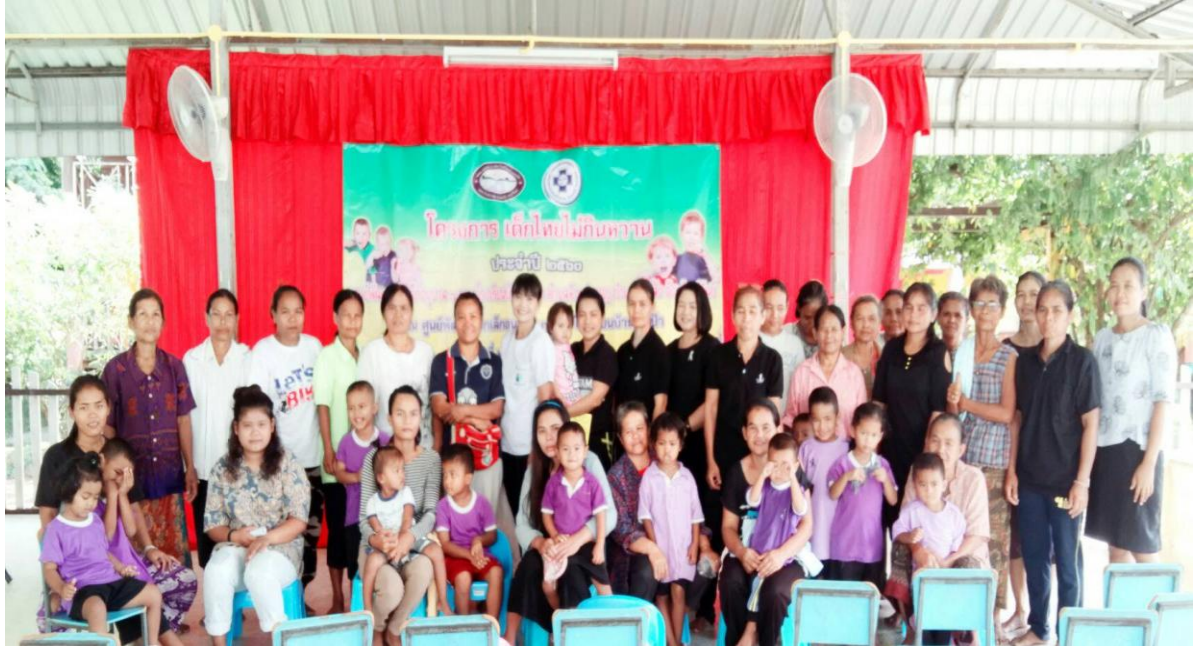
ภาพกิจกรรม โครงการเด็กไทยไม่กินหวาน (อนุบาล ๓ ขวบ โรงเรียนบ้านตาเป่า )