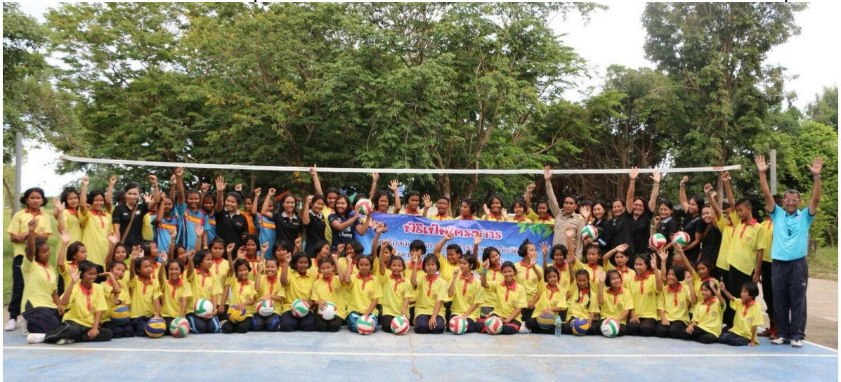
ภาพกิจกรรม โครงการสนับสนุนการออกกำลังกายแก่เด็กนักเรียนและเยาวชนทั้งในโรงเรียนและชุมชน