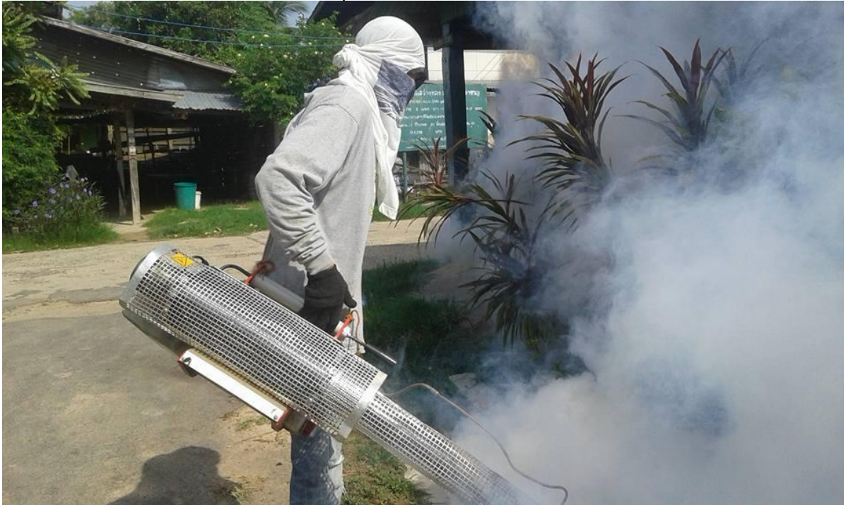
ภาพกิจกรรมโครงการควบคุมป้องกันโรคไข้เลือดออก (กรณีเกิดการระบาด)